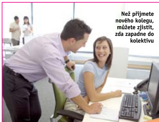
Než přijmete nového kolegu, můžete zjistit, zda zapadne do kolektivu

se pisatel snaží zapůsobit. Nápadné zdůrazňování začátku svědčí o sebepřečehování. Nic dobrého nevěstí ani trojúhelníkové smyčky u písmen j, y, g. Tak píše panovačný a tvrdohlavý člověk a manipulátor. Kolísavý sklon značí potíže se sebeovládáním. Před takovými lidmi se mějte na pozoru.